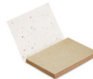
Grow Me MO6234

Bloc-notes à couverture souple de 25 feuilles de papier fabriqué à partir d'herbe et des marqueurs 3 couleurs. Après utilisation, plantez en terre la couverture qui contient une sélection de graines de fleurs sauvages de prairie. Fabriqué en UE.