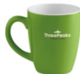
Colour Trent MO9242

Tasse vintage en céramique 240 ml. Emballage individuel dans une boîte en carton blanche. Le transfert en céramique est résistant au lave-vaisselle.