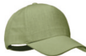
Naima Cap MO6176 Casquette de baseball 5 pans en tissu 100% chanvre 370 gr/m + avec clip en laiton sur fermeture à sangle réglable. 5 œillets surpiqués de couleur assortie. Taille 7 1/4.