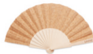
Fanny Cork MO6232

Tongs avec semelle en liège et dessous de semelle en EVA et lanières en PVC. La taille L correspond au 40-43.