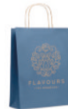
Paper Tone M MO6173

Carnet A6 à couverture cartonnée (250gr/m 2 ) avec 80 pages recyclées cousues en papier de 70 gr.