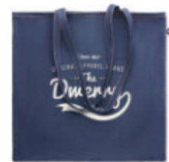
Style Tote MO6420

Sac à cordon en coton 50% denim recyclé et 50% coton. 250 gr/m + .