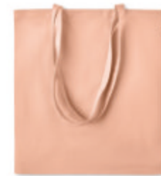
Zimde Colour MO6189

Sac shopping à anses longues en coton organique. 140 gr/m + . Produit sous une norme certifiée pour l'utilisation de substances nocives dans le textile.