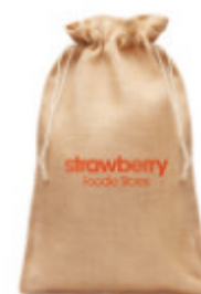
Jute Large MO9930

Sac à provisions en jute, écologique, poignées en coton.