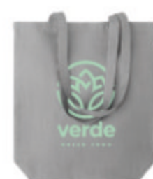
Naima Tote MO6162 Sac shopping en tissu 100% chanvre avec anses longues. 200 gr/m + .