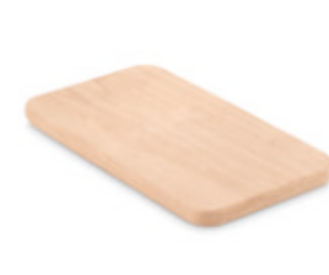
Petit Ellwood MO8860

Planche à découper avec poignée et cordelette, fabriquée en bois d'aulne de l'UE.