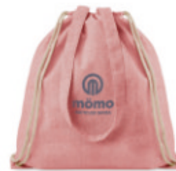
Moira Duo MO9603

2 tone recycled cotton and recycled polyester shopping bag with drawstring and long handles. Approx. 140 gr/m + = Sac shopping 2 tons en coton et polyester recyclés avec cordon de serrage et anses longues. Environ 140 gr/m + . Cet article peut rétrécir après avoir imprimé.