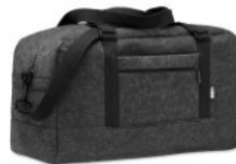
Indico Bag MO6457

Sac à cordon en feutre RPET avec cordons en polyester.