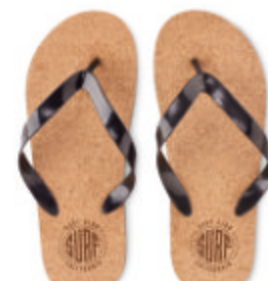
Bombai L MO6403

Sacoche en liège pour ordinateur portable 14 pouces avec rabat à fermeture magnétique.