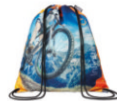
MB3111 Sac à cordon en PET recyclé: 36x40cm.