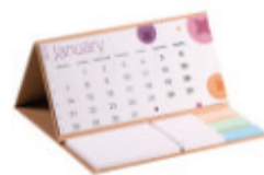
CALECO CALECO CalendoNote couverture rigide recyclée.