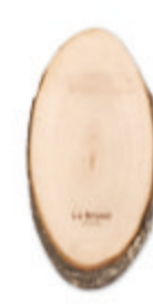
Ellwood Runda MO8862

Planche ovale de taille moyenne avec écorce, fabriquée en UE à partir de bois Adler. Fabriqué dans 1 morceau de bois.