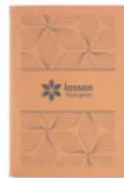
Mid Paper Book MO9867

Carnet A5 à couverture cartonnée (250gr/m 2 ) avec 80 pages recyclées cousues en papier de 70 gr.