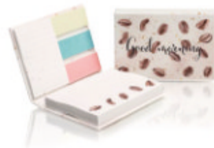
COMBC1 COMBC1 ComboNote couverture rigide à base de déchets de café.