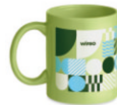
Dublin Tone MO6208

Mug 300ml dans une boîte en carton ondulé individuelle. Pour un marquage en couleur pleine, veuillez nous contacter pour les prix.