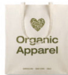
Organic Cottonel MO8973

Sac shopping en coton bio à anses longues. 105 gr/m + . Fabriqué à partir de coton biologique produit sous un label certifié.