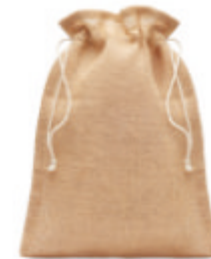
Jute Medium MO9929

Sac cadeau grande taille en jute avec cordon. Dimension env. 30 x 47 cm.