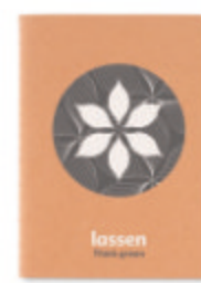
Mini Paper Book MO9868

Carnet A5 à couverture cartonnée (250gr/m 2 ) avec 80 pages recyclées cousues en papier de 70 gr.