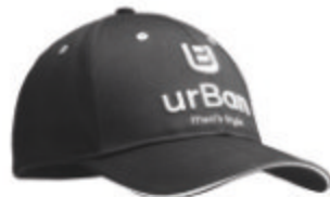
MH2103 MH2103 Recycled PET fabric Cap heavy cotton with sandwich.