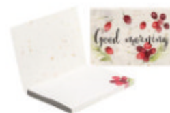
SNCS50 SNCS50 Notes adhésives en papier recyclé avec couverture souple papier à base de café.