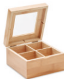
Campo Tea MO9950

Boîte à thé en bambou avec couvercle verre transparent. les 4 compartiments peuvent contenir 24 sachets de thé. Le bambou, produit naturel, peut avoir des variations de couleur de taille par article.