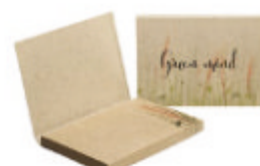
SNGG50 SNGG50 Notes adhésives avec couverture souple, le tout en papier à base d'herbe.