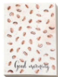
NOPCC5 NOPCC5 Carnet couverture souple en papier à base de café.