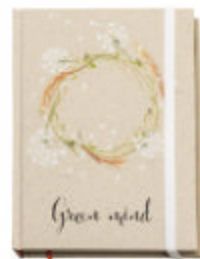
NOTEG5 NOTEG5 Cahier à couverture rigide en papier d'herbe.