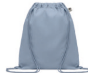
Yuki Colour MO6355

Sac de conservation alimentaire moyen format en coton biologique. 140 gr/m + .