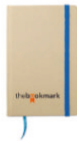
Evernote MO7431 A6 calepin en papier recyclé avec ruban couleur assortie et bande élastique. 96 pages de papier vierge.