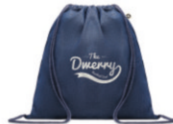
Style Bag MO6422

2 tone recycled cotton and recycled polyester shopping bag with drawstring and long handles. Approx. 140 gr/m + = Sac shopping 2 tons en coton et polyester recyclés avec cordon de serrage et anses longues. Environ 140 gr/m + . Cet article peut rétrécir après avoir imprimé.