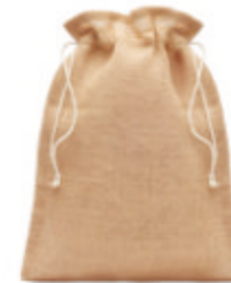
Jute Small MO9928

Sac cadeau de taille moyenne en jute avec cordon. Dimension env. 25 x 32 cm.