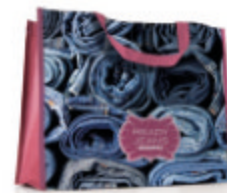
MO4070 Sacs horizontaux. 36x32x12cm.