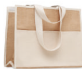
Campo De Geli MO6160

Sac shopping en jute avec anses longues, pelliculé, fermeture auto-agrippante, devant avec pochette en toile et sangle en coton.