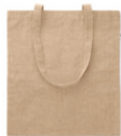
Cottonel Duo MO9424

Sac shopping avec longues anses en coton recyclé 50% denim et 50% coton. 250 gr/m + .