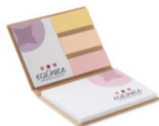
COMBE1 COMBE1 ComboNote couverture rigide recyclé.