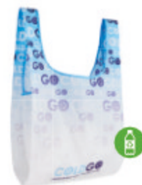
MB1111 Sac à provisions pliable en RPET avec pochette intérieure: 41x63cm.