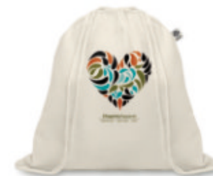
Organic Hundred MO8974

Sac à cordon en coton organique. 140 gr/m + . Fabriqué en coton organique certifié.