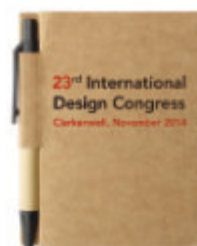
Cartopad MO7626 Bloc-notes 80 pages et mini-stylo en matière recyclée. Encre bleue.