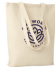
Fresa Soft MO9639

Filet à provisions réutilisable. Un côté est en coton (140gr/m+) et l'autre en filet de coton (110gr/m+). Fermeture par cordon. Produit sous une norme certifiée pour l'utilisation de substances nocives dans le textile.