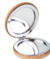
Guapa Cork MO9799

Miroir compact double face et couverture en liège. Le liège est un matériau naturel, en raison de sa nature structurelle et de sa porosité de surface, le résultat d'impression final par article peut présenter des écarts.