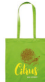
Cottonel Colour + MO9268

Sac shopping en coton avec anses longues. 140 gr/m+. Produit sous une norme certifiée pour l'utilisation de substances nocives dans le textile.