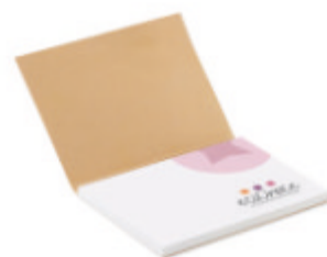
SNES50 SNES50 Sticky notes avec couverture souple recyclée.