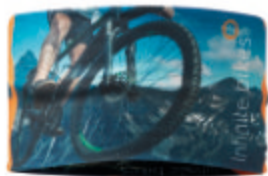
MH3101 MH3101 100% RPET (140gsm). Taille env. 25x11cm.