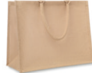
Brick Lane MO8965

Sac de plage ou de shopping en toile de jute pelliculée avec anses en coton, anses courtes.