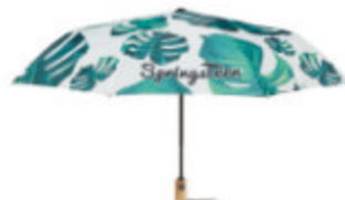
MU2006 MU2006 Parapluie "21", 3 sections avec poignée en RPET.