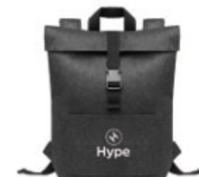
Indico Pack MO6456

Organiseur de voyage en feutre RPET avec 2 compartiments intérieurs et 4 compartiments extérieurs.