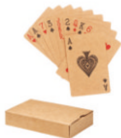
Aruba + MO6201 Cartes à jouer classiques en papier recyclé dans une boîte en papier recyclé. 54 cartes.