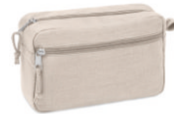
Naima Cosmetic MO6165 Trousse à cosmétiques avec double fermeture éclair. Tissu 100% chanvre. 200 gr/m + .