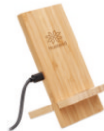
Whippy Plus MO6277

Lunch box en bambou avec séparateur amovible et sangle élastique en nylon. Ne peut contenir que des aliments secs. Capacité : 650 ml.