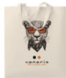
Marketa + MO9847

Sac shopping en coton à anses courtes. 140gr /m+. Produit sous une norme certifiée pour l'utilisation de substances nocives dans le textile.