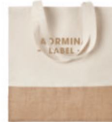
India Tote MO9518

Sac shopping en jute avec anses longues, pelliculé, fermeture auto-agrippante, devant avec pochette en toile et sangle en coton.