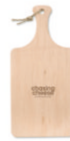
Ellwood Lux MO9624

Planche à découper ovale en bois avec écorce