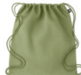
Naima Bag MO6163 Sac à cordon en tissu 100% chanvre. 200 gr/m + .