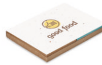
Grow Me MO6235

Carnet à spirale couverture en bambou avec 70 pages en papier recyclé. Comprend un stylo à bille en bambou assorti avec des embouts en ABS et un clip.