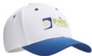
MH2101 MH2101 Recycled PET fabric Cap.