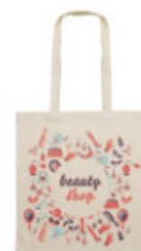
Cottonel + MO9267

Sac shopping en coton à anses courtes. 140gr /m+. Produit sous une norme certifiée pour l'utilisation de substances nocives dans le textile.