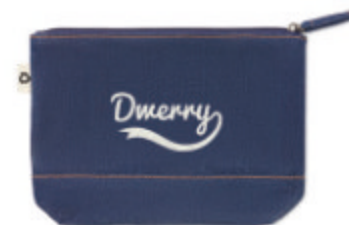
Style Pouch MO6421

2 tone recycled cotton and recycled polyester shopping bag with drawstring and long handles. Approx. 140gr/m + = Sac shopping 2 tons en coton et polyester recyclés avec anses longues. Environ 140 gr/m + . Cet article peut rétrécir après avoir imprimé.