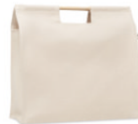
Mercado Top MO6458

Sac shopping à anses longues en coton organique. 140 gr/m + . Produit sous une norme certifiée pour l'utilisation de substances nocives dans le textile.