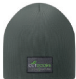
MW1101 MW1101 Bonnet double épaisseur. 100% RPET.