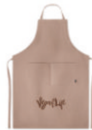
Naima Apron MO6164 Tablier de cuisine ajustable avec 2 poches avant en tissu 100% chanvre. 200 gr/m + .